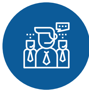
Customer Service Atención y Soporte al Cliente.