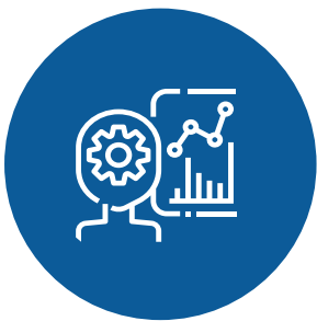
IT Service Management (ITSM) Gestión TI alineada con ITIL®.

Gracias a la combinación de una amplia funcionalidad, un alto nivel de configuración sin necesidad de programar y su facilidad de uso, nuestros clientes se benefician de una plataforma única de automatización y gestión de servicios, aplicable en tres grandes áreas: